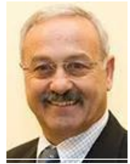
Nazih Musharbash Präsident der DPG